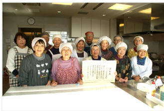
我孫子会場の皆さん

昨年11月、長きにわたるボランティア活動が評価され、厚生労働大臣表彰を受賞したふれあい弁当の会。これからも益々のご活躍が期待されます。