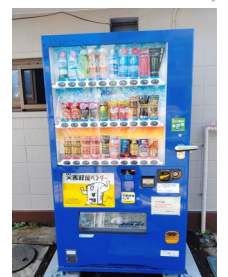
天王台ハイツ自治会様