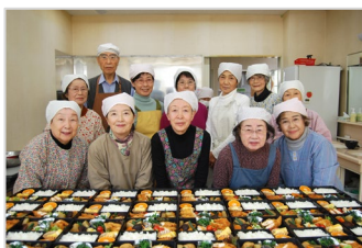
久寺家会場の皆さん

お弁当と一緒に届けられるカード。四季折々の風情が感じられるテーマが好評で、このカードを心待ちにしている利用者も多いそう