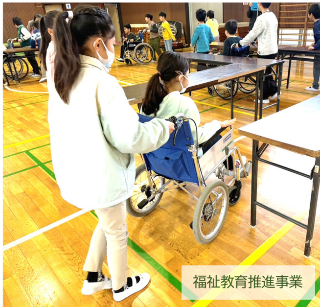
福祉教育推進事業