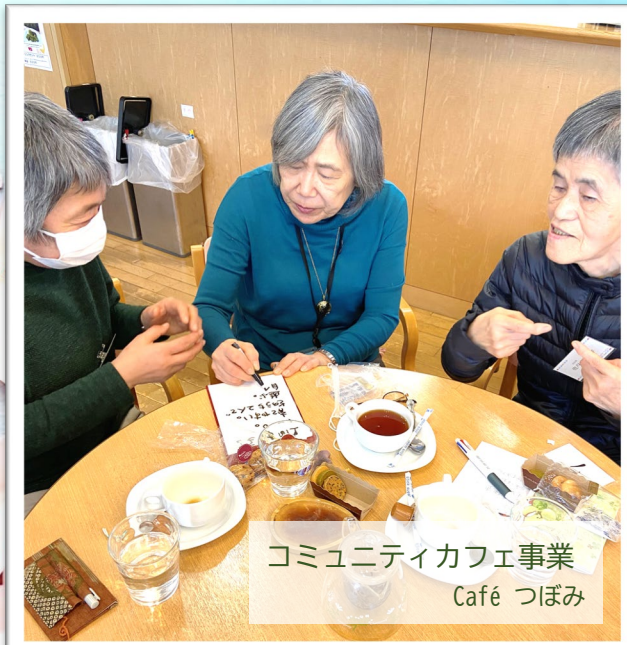
コミュニティカフェ事業 Café つぼみ