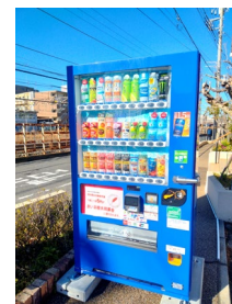
医療法人社団創健会 こやの皮フ科様