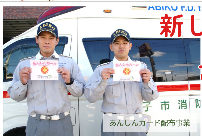
あんしんカード配布事業