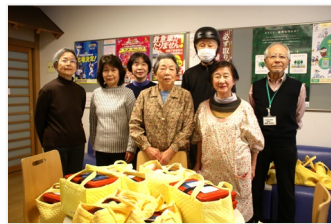
カード班の皆さん