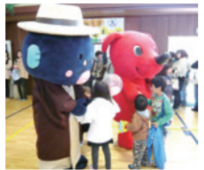
昨年のこほく福祉まつり