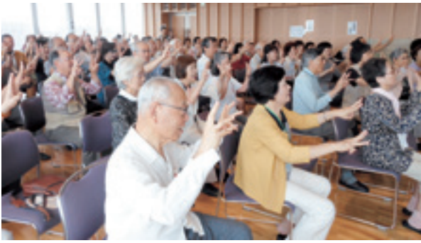
昨年の健康まつり

申・問 9月30日(金)まで。我孫子南地区社協(月～金曜日、午前9時～午後4時) ☎・FAX (7185) 5117