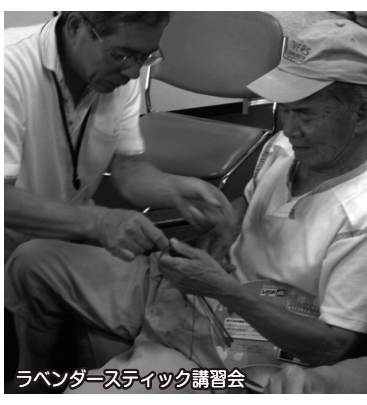
ラベンダースティック講習会