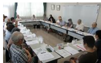
布施・久寺家地域

ただ総体的には、まち協・自治会・民生児童委員他各地域の団体等との連携は密接にしており、見守りは概ね良くされています。シニア団体からの感謝の言葉もありました。今後とも皆様の地域福祉や見守りについてご協力よろしくお願いいたします。