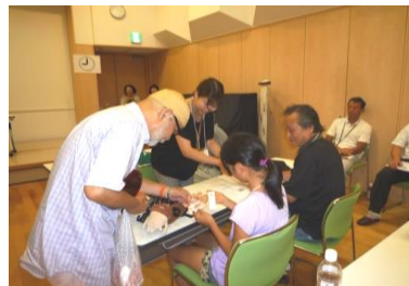
講習後のレゾリング授与