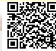
我孫子市公式サイト

あなた自身がもしもの時の通知先（管理者）を設定できる。また、あなたが管理者となり見守りたい方を招待して、もしもの通知を受け取る。 ※直接利用者と近親者（管理者）をつなぐサービスです。