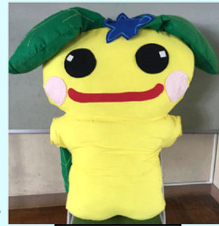
マスコット「ケヤキン」

高野山小学校では、昨年度よりコミュニティ・スクールとしての活動を始めました。学校運営協議会委員、地域学校協働活動推進員、校長、教頭がチームとなり、「地域とともにある学校」について考え、活動しています。