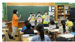
第二小認知症サポーター講座

問合せ・連絡先 天王台地区社会福祉協議会（天王台地区社協）事務局 開設日時 月～金曜日（祝日及び第2・4火曜日は休み） 午前9時～12時・午後1時～4時 所在地 〒270-1144 我孫子市東我孫子1-41-33 近隣センターこもれび内 ☎・FAX 04-7183-9009 E-mail: tennoudai@abiko-shakyo.com