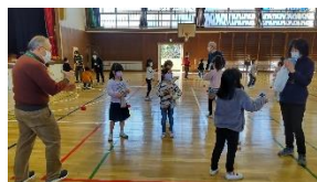
高野山小昔遊び教室

「ゆうゆうだより」の作成を担う今年度の広報部会メンバーは新規担当者6名を加え、総勢12名の陣容で対応致します。10月からは、地域の安心・安全MAPの作成と作成済MAPの再調査と修正をします。天王台地区社協全体としては、後半に向け学校での福祉体験学習、世代間交流への参加協力、健康フェア、お楽しみ会等各種イベントの開催を予定しております。今後も地域に根ざした活動を行ってまいります。(M/I)