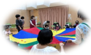
パラバルーン(企画)