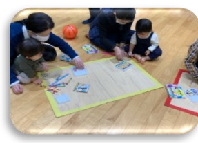
みんなで工作(企画)