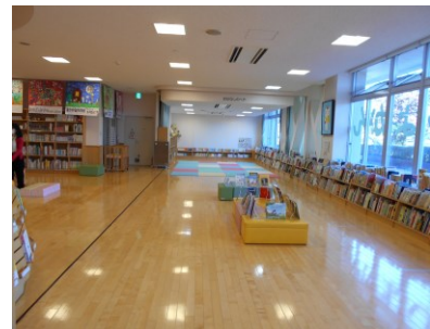
入り口から見た室内