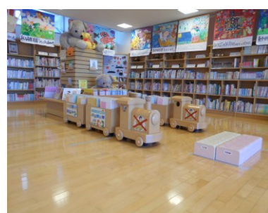
紙芝居を運ぶ自動車