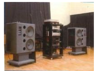
つくし野コミュニティホール内 使用スピーカー タンノイモニター215 (38cmダブルウーハー)