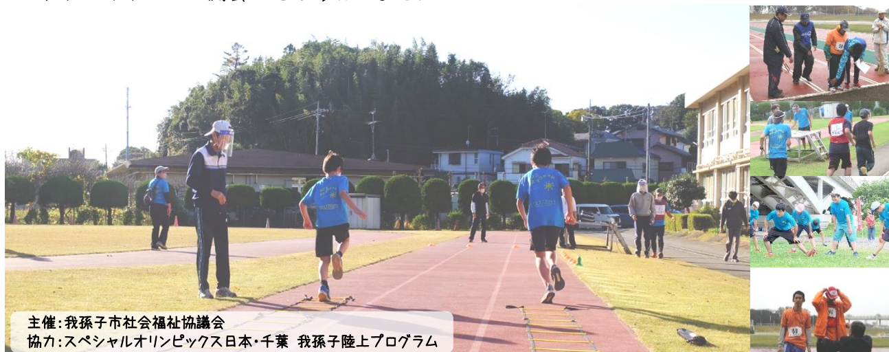
主催：我孫子市社会福祉協議会 協力：スペシャルオリンピックス日本・千葉 我孫子陸上プログラム

知的障害や発達障害がある小学生～大人が主役の陸上競技団体に、スポーツボランティア体験をします。オリエンテーションで事前学習できるので、初めての人でも参加しやすいです！この機会にぜひ参加しませんか？