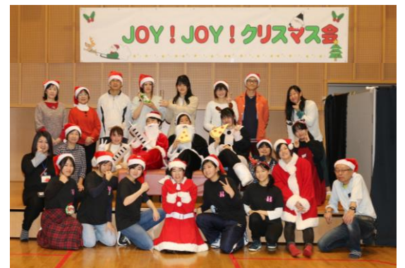
JOY!JOY!クリスマス実行委員会が楽しい企画を考えて、みんなを待っています!

▼日時：12月1日(日) ①10:00～11:30(受付 9:30) ②13:30～15:00(受付13:00) ▼場所：我孫子南近隣センター (けやきプラザ内9階ホール) ▼定員：各回70人(先着順) 申込不要 ▼費用：無料 ▼内容：演奏・ダンス・演劇他 ※プレゼントあり