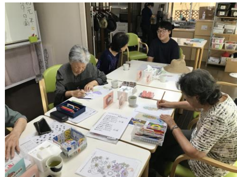
利用者さんと工作・お話しタイム