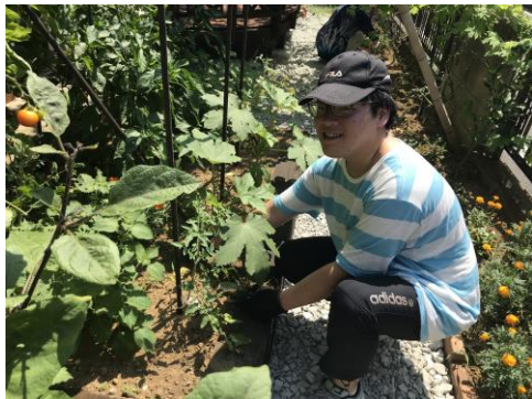
施設のお庭の畑で雑草を抜いたり整備するボランティア活動中

最近、中・高・大学生のボランティア希望の方がとても増えています。今号は、学生ボランティアの活動の様子をご紹介します。