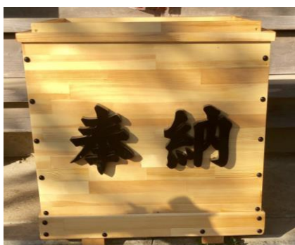
令和元年5月 寄贈の賽銭箱

住み良いまちづくり研究所からの寄贈品で、我孫子市のリサイクル施設「ふれあい工房」の手作りです。