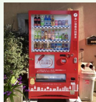
綺麗なラッピングです☆

福祉自動販売機を設置していただける市内の企業を募集しています。既存の設置協力店は、ホームページで見ることができます。