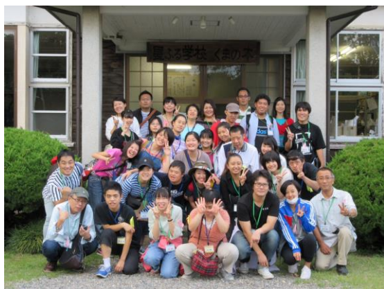
前回のキャンプ参加者集合写真

今回(開催日9月22日~23日)のバス旅行の前に、「ボランティアでぜひ参加してみたい!」「もう少し詳しく知りたい!」「今年もまた参加したい!」という方々のために、ボランティア交流会を企画しました。