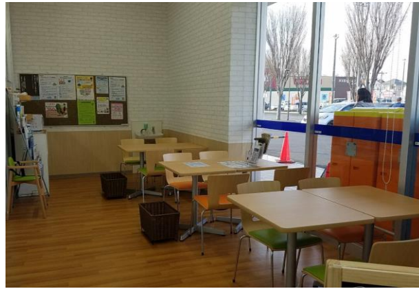
ウエルシア我孫子新木駅前店のフリースペース