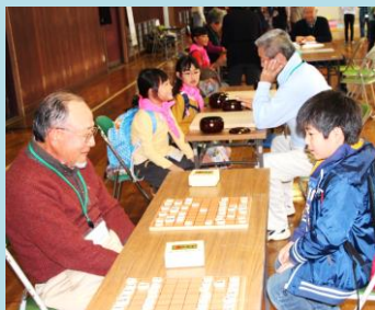
将棋・囲碁で児童と交流

コマ、ベーゴマ、おはじき、あやとり、お手玉、折紙、囲碁、将棋など昔の遊びを通して楽しさを伝えて交流をしています。