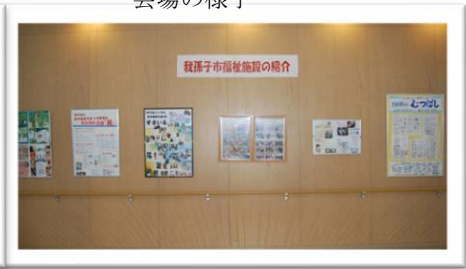
福祉施設のパネル展示