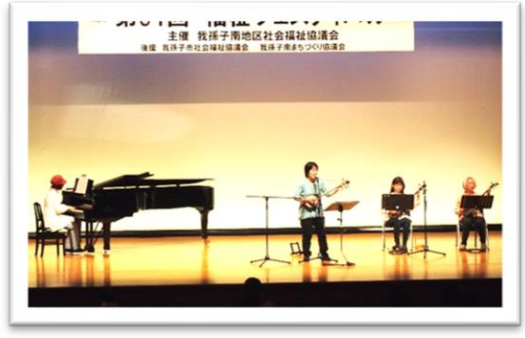
沖縄三線と歌「ウタ結イ」