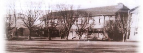
【昭和30年代の木造校舎】 後ろが国道356号

寿は我孫子市制（昭和45年7月）に先がけて、昭和42年4月の住居表示で誕生しました。