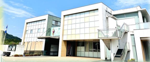
茨城県陶芸美術館