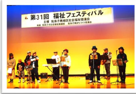
軽音楽「ホットポットファミリー」