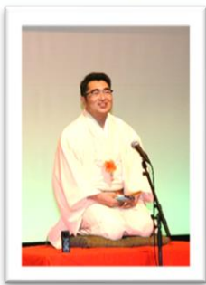
落語「山遊亭金太郎さん」