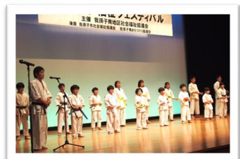
空手演武「極真会館 我孫子道場」