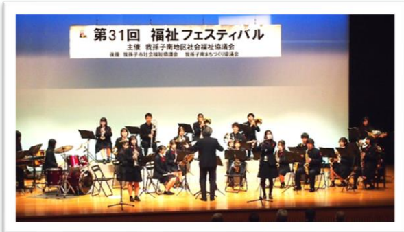
吹奏楽「我孫子高等学校」