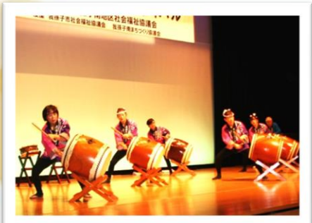
和太鼓「我孫子河童太鼓」