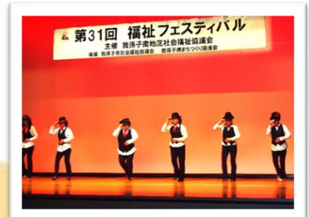
ダンス「我孫子アルゼンチンタンゴ協会」