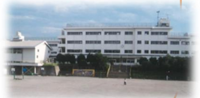
【現在の第一小学校校舎】