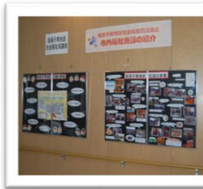
南地区社協の事業紹介