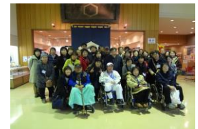
楽しい旅行の思い出となりました