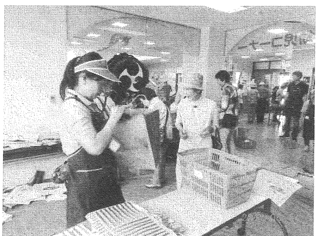
お買い上げありがとうございます(袋詰)