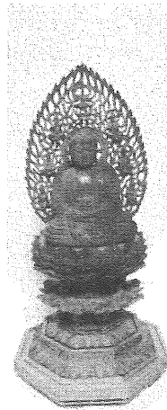
釈迦如来 仏8cm 光背迄の高さ22cm

方に信頼されてこられたのです。「人生は楽しまなければ」と。少し前に体調を崩されてしまわれたが退院後に長寿友の会「湖北台団地」に出席し、輝夫さんが歌を唄われたら復帰を喜んで何人かの方が涙を流してくださったそうです。これには輝夫さんもまいったまいったと感激されたとのこと。輝夫さんの人柄が皆さんに愛され慕われている何よりの証拠。傍らでてんぐさで喉ごしよいところてんを作れる房枝さん。にこにこ内助の功が滲みでている素敵なお夫婦。輝夫さん今年「後期(幸輝)高齢者」の星(スター)として輝き続けて下さいね。(福)