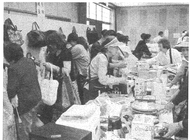
日用雑貨コーナー