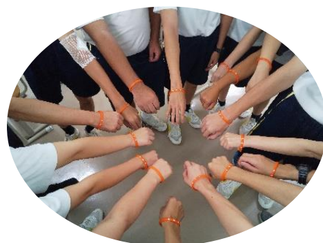
オレンジリングを手首に 認知症サポーターの証

最後に、認知症サポーターになった証『オレンジリング』をつけて、みんなで認知症の方を支えていこう！と記念撮影をし、とても有意義な時間になりました。