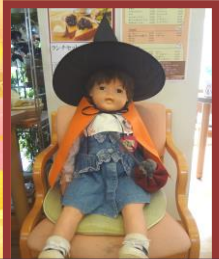
ハロウィンなので 仮装しました♪