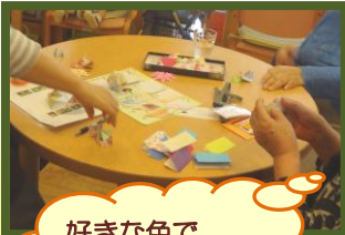
好きな色で 折り紙♪