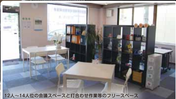
12人～14人位の会議スペースと打合わせ作業等のフリースペース