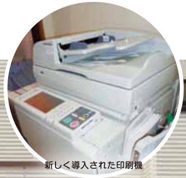
新しく導入された印刷機