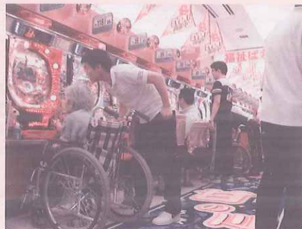
福祉パチンコ大会の様 皆さん真剣な眼差し!