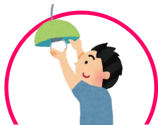
電球・電池の交換

暮らしの中で感じる「ちょっとした困りごと」や「不便と感じる簡単な作業」をお手伝いする事業です。